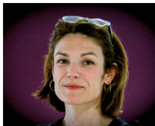
Chantal Jouanno Présidente de la Cndp